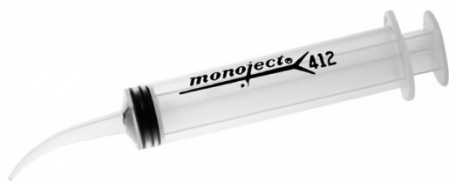
Afb. 1 - Tip: spoelspuitje in de wond

Wanneer u terugkomt bij Kaakchirurgie Holland zal de assistente eerst met u praten en naar de wond kijken en als het nodig is, voor u uitspoelen. Mocht het nodig zijn dan kan de kaakchirurg er nog naar kijken.